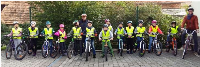
Vor der Radfahrprüfung

Noch vor den Herbstferien haben die Schülerinnen und Schüler der 4. Klasse VS die freiwillige Radfahrprüfung erfolgreich abgelegt!