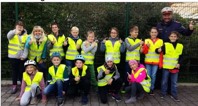
Bestanden - die Freude ist groß!!